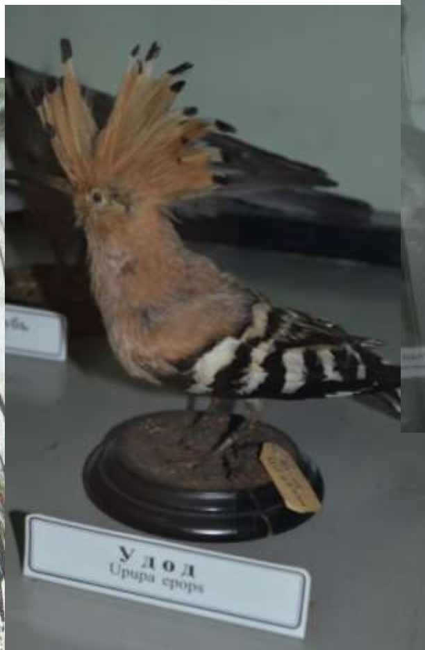
Удод Upupa epops