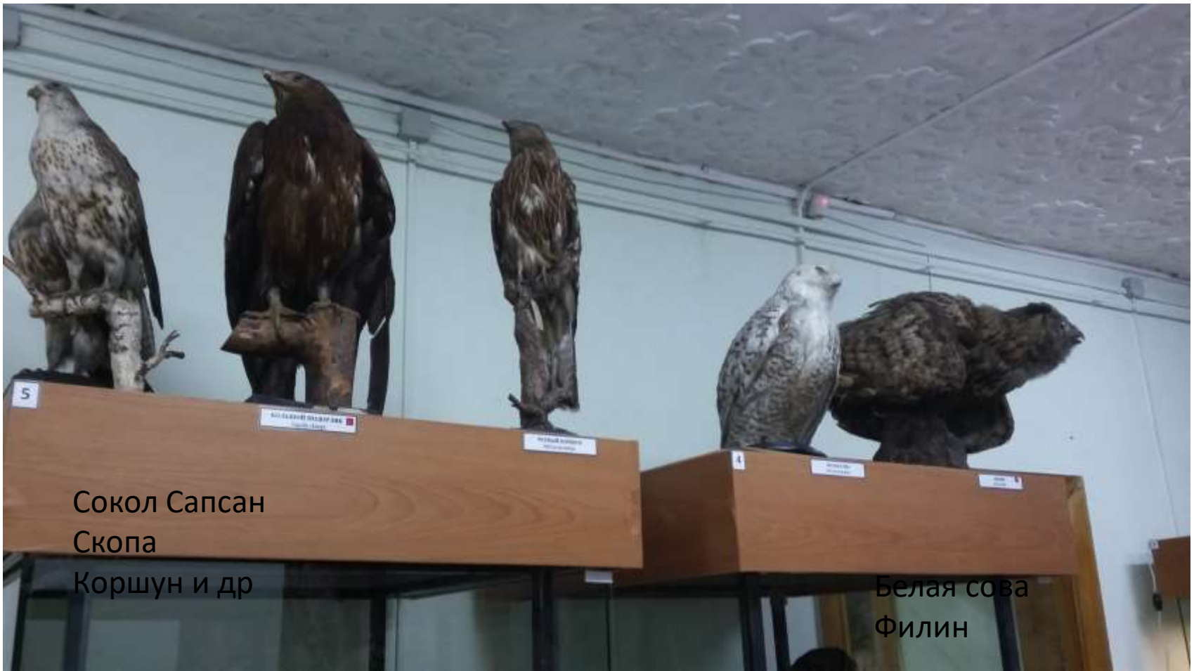
5 Сокол Сапсан Скопа Коршун и др